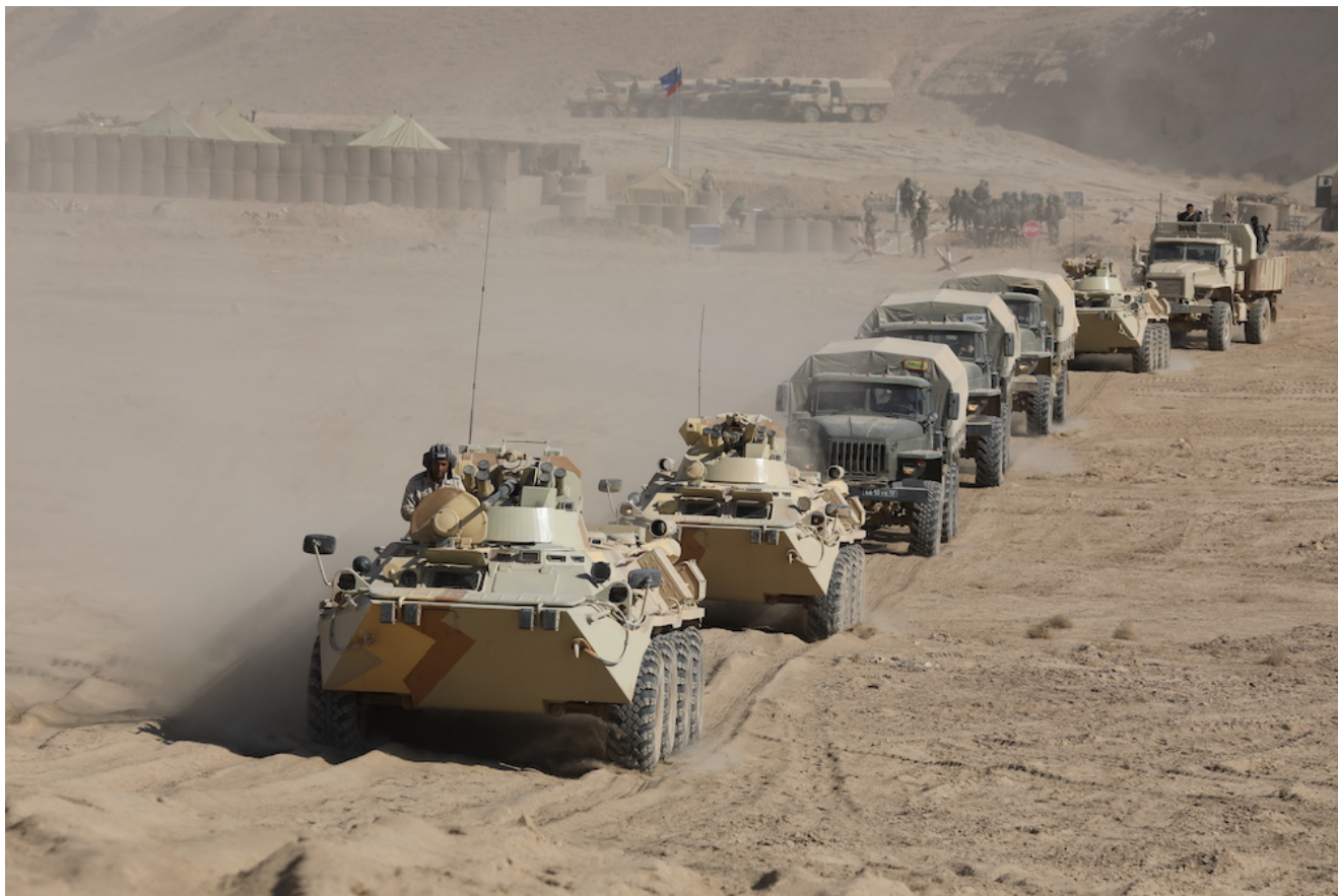
Совместные учения стран ОДКБ «Нерушимое братство-2019» в Таджикистане.

Андрей Грозин отмечает, что в рейтингах не оценивается также уровень подготовки в ведении военных боевых действий с подключением новой технической деятельности. Это касается беспилотных летальных аппаратов, управления войсками с системами радиоэлектронной борьбы и всего, что касается высоких технологий. Да и в целом техническое оснащение армий стран Центральной Азии в основном российского производства, а также то, что осталось после советской армии.