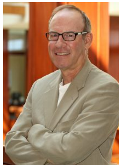
Рой Питер Кларк.

В этом жанре журналистики обязательно присутствует «голос автора». Хороший репортаж всегда индивидуален, а при его чтении в голове возникает зрительный ряд. Рой Питер Кларк, американский писатель, редактор и автор книги «50 приемов письма» даже ввел термин «писать кинематографично». То есть так, чтобы текст рождал в голове читателя кадр за кадром.