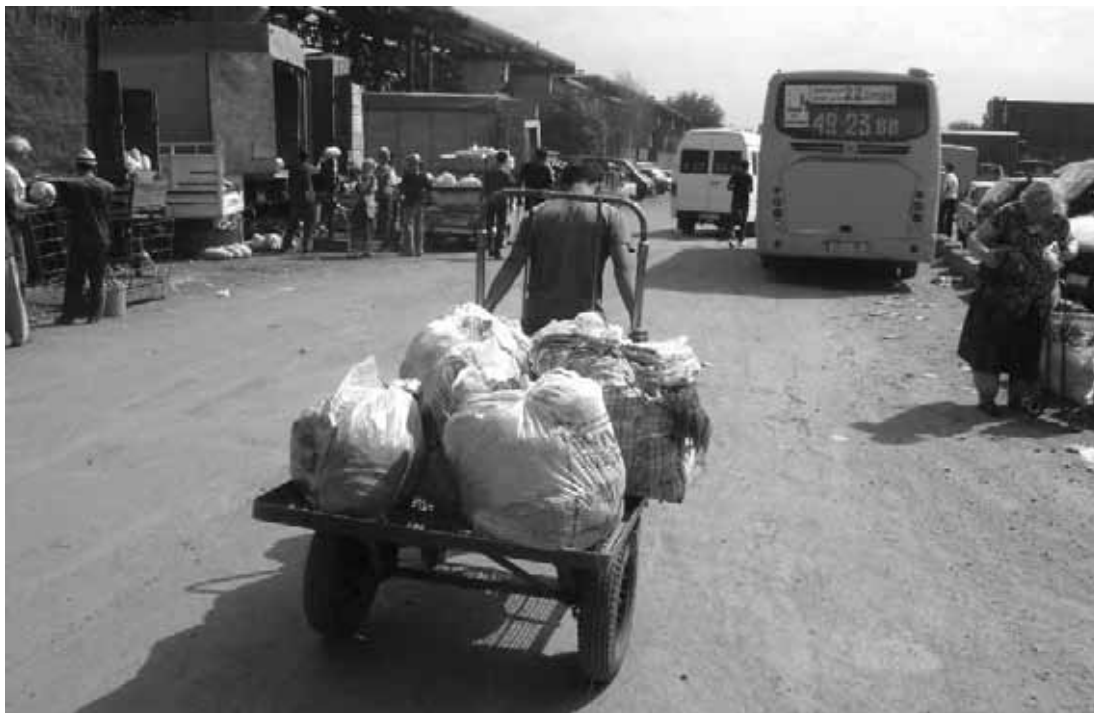
Өлкөдөгү оор турмуш балдардын мектепти таштоосуна себеп болууда

«Жол бергиле, жол, жол!» - деп кыйкырган арыкчырай өспүрүм, Кыргызстандын борбору Бишкектин жер-жемиштерди саткан дыйкан базарында, көп элдин ичинде араба менен өзүнө жол ачып келе жатты.