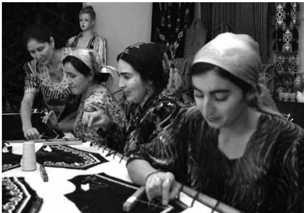
Качан эмгек мигранттары үйүнөн кол үзүп, акча салууну токтотушканда, алардын үй-бүлөсүнүн абалы начарлай баштаган.

Ошол эле мезгилде, массалык эмгек миграциясынын натыйжасында көптөгөн тажиктер финансалык абалын бир топ жакшыртышкан учурлар кездешсе, айрымдары тескерисинче өз үйүнө акча салууну токтоткон учурлар да жок эмес. Буга байланыштуу анын үй-бүлөсү өлкөдөгү эң кедейлердин катарына кошулган.