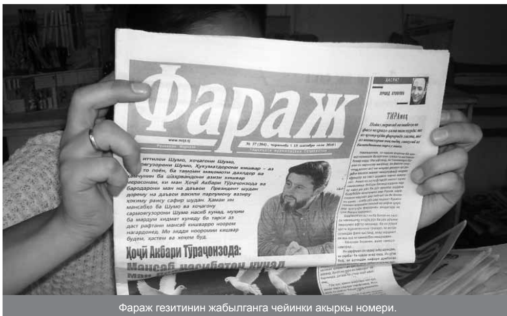
Фараж гезитинин жабылганга чейинки акыркы номери.