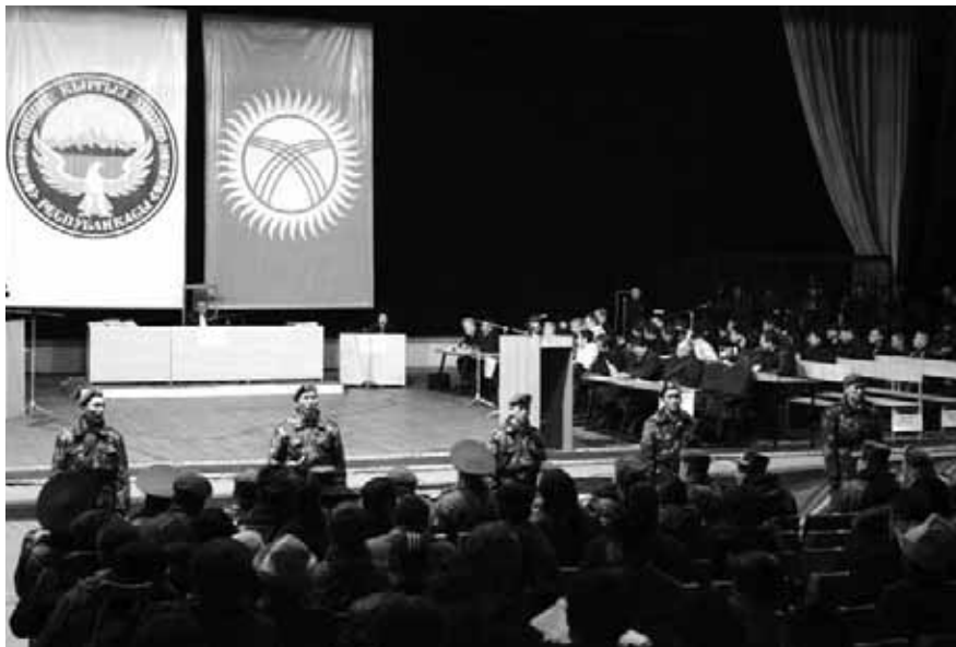
Бишкектеги апрель окуясы боюнча өтүп жаткан сот жараяны

Бишкекте өтүп жаткан соттук териштирүүлөрдө президенттин буга чейин жоюлуп кеткен Коопсуздук кызматынын жана Улуттук коопсуздук кызматынын курамына кирген «Альфа» аттуу элиталык топтун мурдагы кызматкерлери айыпталышууда. Мындай соттук териштирүүлөргө өз мезгилинде мурда Бакиевдин режими менен кызматташкан айрым түштүктүк саясатчылар да нааразы.