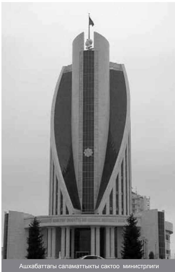
Ашхабаттагы саламаттыкты сактоо министрлиги

Бийлик медициналык тейлөө кызматынын начардыгына тынчсызданганын билдирүүдө. Алардын көз карашында, бейтаптар саламаттыкты сактоо кызматкерлеринин адистик даярдыгынын төмөндүгүнөн эле эмес, бизнес кылган