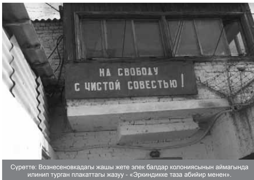
Сүрөттө: Вознесенкадагы жашы жете элек балдар колониясынын аймагында илинип турган плакаттагы жазуу - «Эркиндикке таза абийир менен».