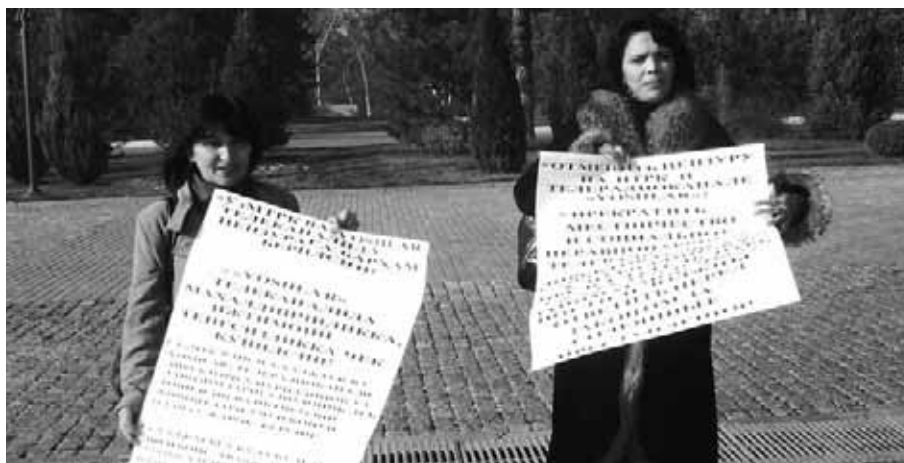
Өзбекстандын улуттук телерадиокомпаниясынын «Ёшлар» каналынын кызматкерлеринин цензурага каршы нааразылык акциясы, 2010-жылдын, 6-декабрында Ташкенттеги эркиндик аянтында.