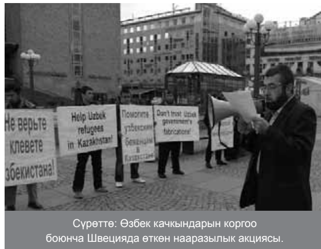
Сүрөттө: Өзбек качкындарын коргоо боюнча Швецияда өткөн нааразылык акциясы.

«тыюу салынган уюмга» мүчө деп айыпталып жатса, андай уюмдун ишмердүүлүгүнө Казакстанда же башка мамлекетте тыюу салынгандыгын тактабай туруп эле, ал качкындын өтүнүчү четке кагыла тургандыгы айтылган.